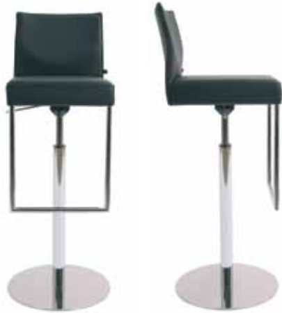
VARIANTE 1 : BARHOCKER KURZER VERSTELLBEREICH VERSION 1 : BARSTOOL SHORT ADJUSTMENT WAY