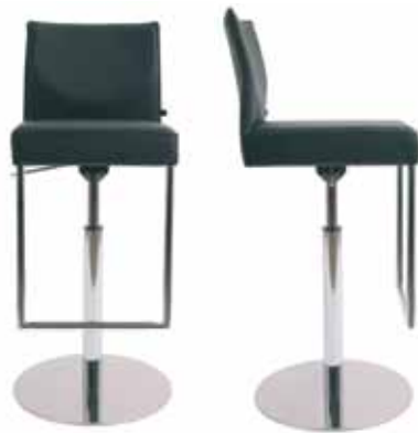
VARIANTE 2 : BARHOCKER GROSSER VERSTELLBEREICH VERSION 2 : BARSTOOL LONG ADJUSTMENT WAY